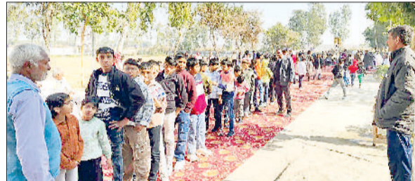
झंझर। संस्थान में प्रतिभा खोज परीक्षा देने पहुंचे विद्यार्थी।