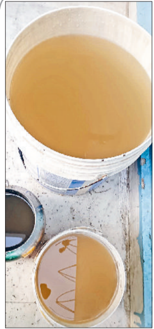
बहादुरगढ़। सेक्टर-6 में सप्लाई किया जा रहा दूषित पेयजल।