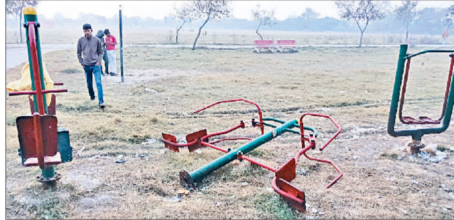
बहादुरगढ़। हाई स्कूल के ग्राउंड में टूटी मशीनें।