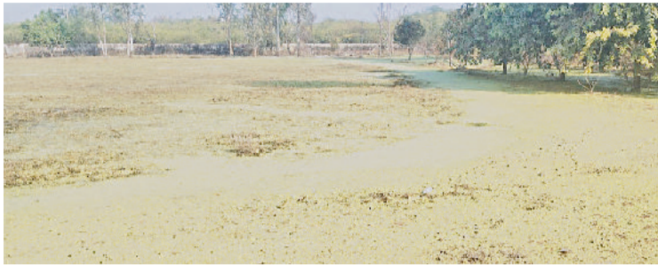
बहादुरगढ़। राजीव गांधी स्टेडियम के ग्राउंड की हालत।