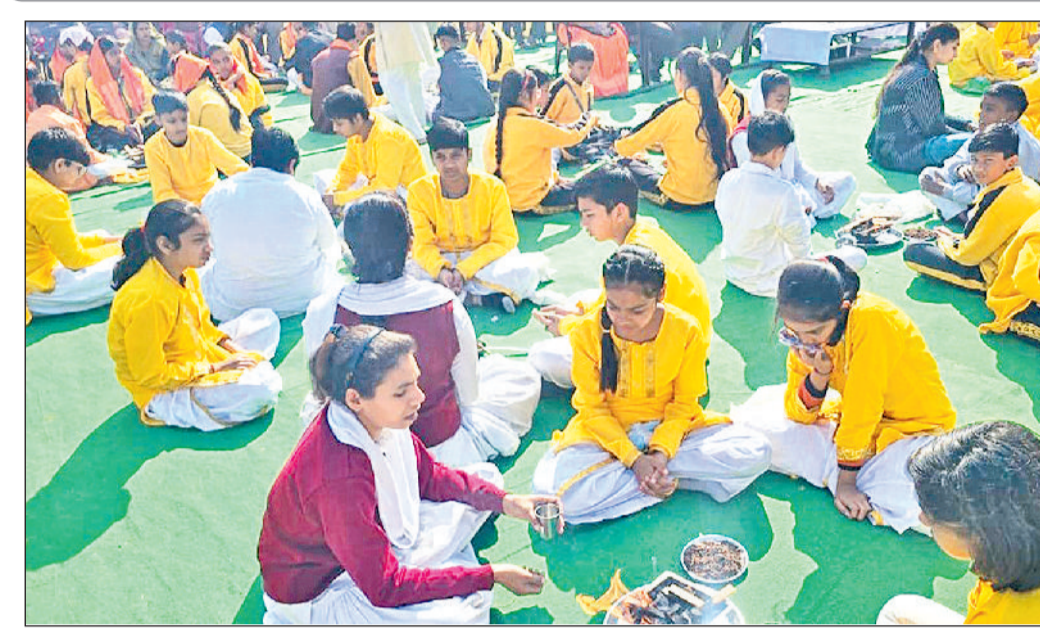
बहादुरगढ़। सी कुंडीय यज्ञ में आहूति डालते डीएवी स्कूल के विद्यार्थी।

कार्यक्रम के दौरान अतिथियों ने युवाओं को नशे के दुष्परिणामों से बचने, समय का सदुपयोग करने तथा सकारात्मक जीवन शैली अपनाने का संदेश दिया।